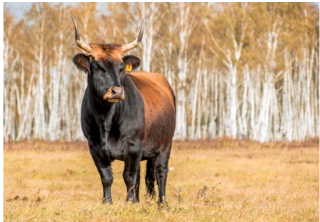
Heckrind in der Oranienbaumer Heide. Die munitionsbelastete Fläche wurde bis 1992 militärisch genutzt (Foto: Theresa Petzold).

Bei der Einrichtung von Beweidungen auf munitionsbelasteten Flächen oder Munitionsverdachtsflächen sind die Ordnungsbehörden einzubeziehen und die flächenspezifischen Gefahrenabwehrverordnungen zu berücksichtigen. Zu unterscheiden sind hier Bereiche, auf denen auf Grund nachgewiesener Belastungen ein Betre-