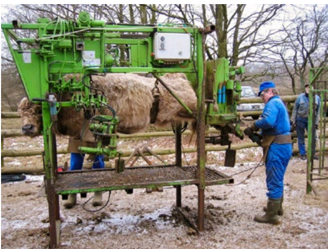
Ist die natürliche Abnutzung nicht ausreichend, ist eine fachgerechte Huf- und Klauenpflege durchzuführen.

arzt/von der Tierärztin als notwendig angesehen wird, sollte sie einige Wochen vor dem Frühjahrsaustrieb im Stall oder auf der Winterweide erfolgen.