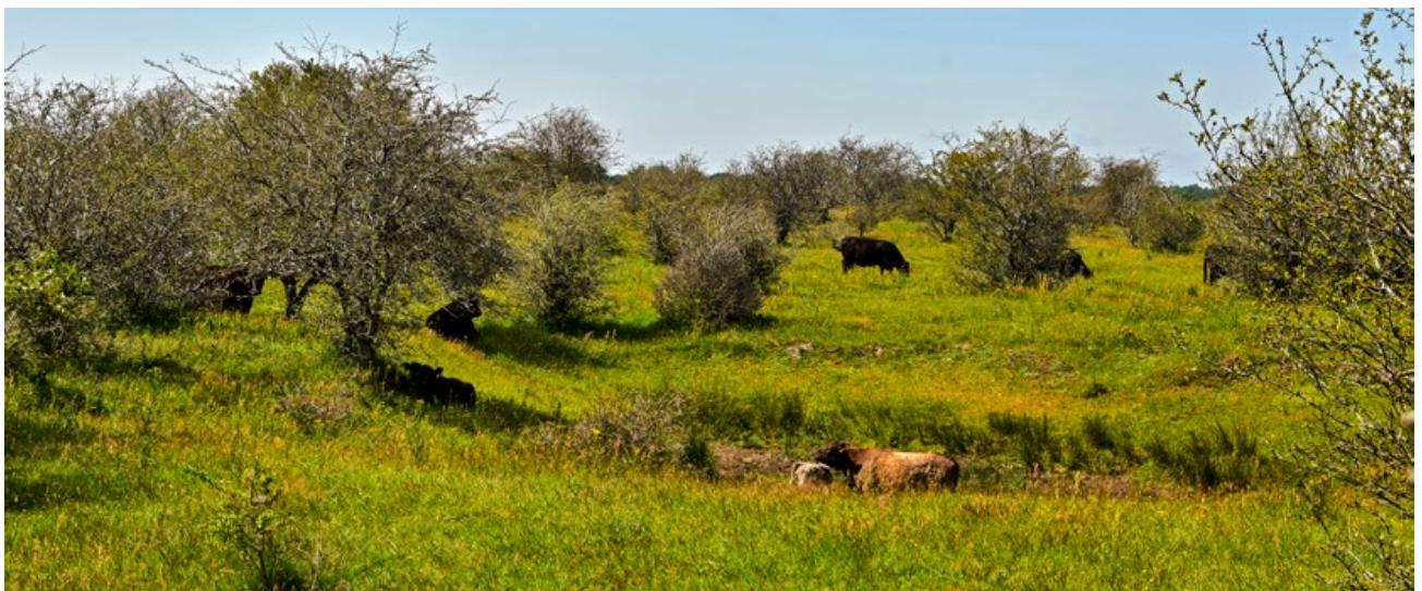
In reich strukturierten Weidelandschaften, wie den „Wilden Weiden Schäferhaus“ ist der Witterungsschutz ganzjährig gegeben (Foto: Stiftung Naturschutz Schleswig-Holstein).