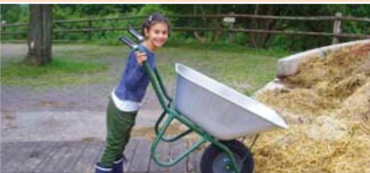
Entmisten gehört zu den täglichen Stallarbeiten.