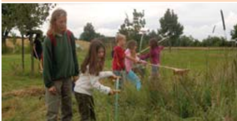
Sensen und Heumachen auf der Streuobstwiese