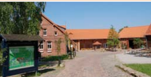
Gut Herbigshagen ist das ehemalige Stadtgut von Duderstadt.

Vor den Toren Duderstadts, an der ehemaligen inner-deutschen Grenze, liegt Gut Herbigshagen – die Stiftungszentrale der Heinz Sielmann Stiftung. Das 1996 gegründete Natur-Erlebniszentrum ist heute anerkanntes Regionales Umweltbildungszentrum (RUZ) des Landes Niedersachsen, Mitglied der Bundesarbeitsgemeinschaft Lernort Bauernhof e.V. (BAGLoB) sowie zertifizierter Biolandbetrieb. Der Betrieb wirtschaftet auf 110 ha Fläche mit Acker, Wald und Wiese und beherbergt bedrohte Haustierrassen wie z. B. Harzer Rotvieh, Skudden-Schafe sowie Thüringerwald Ziegen.