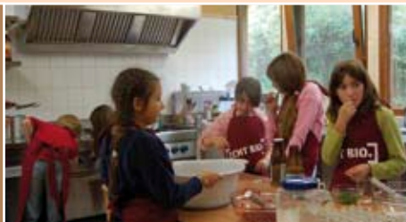
Gemeinschaftliches Zubereiten von Speisen macht Spaß.