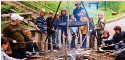
Immer wieder beliebt – Stockbrot am Lagerfeuer