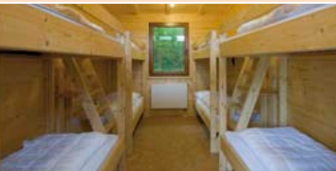
Rustikal eingerichteter Gruppenschlafraum

Die Teilnehmer wohnen in einem modernen Holzhaus mit großem Aufenthaltsraum und komplett eingerichteter Küche zur eigenen, kreativen Nutzung. Für die Schüler stehen fünf Mehrbettzimmer zur Verfügung, für zwei Betreuer auch Einzelzimmer. Die Vollverpflegung ist ökologisch ausgerichtet. Die Küchengruppe des jeweiligen Tages übernimmt in eigener Regie die Tischdienste (Tischdecken, Essenausgabe, Bedienung Spülmaschine etc.). Hierbei gibt es keine zusätzliche personelle Unterstützung seitens unserer Einrichtung. Die warme Mittagsmahlzeit wird komplett angeliefert und durch die Küchengruppe ausgeteilt.