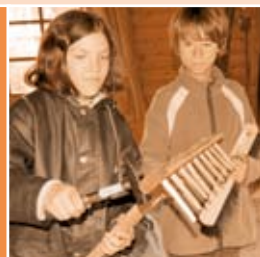
Ich fand es hier einfach klasse. Schnitzen, Waldspiele, Fledermäuse ... alles war dabei.