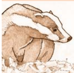
Ein Besuch bei den Tieren im Stall lohnt sich immer.

Wie Heinz Sielmann die Natur erleben! Mit der Kamera kannst du unter professioneller Anleitung spannende Naturbeobachtungen machen. Du lernst, interessante Motive zu entdecken, diese im Foto festzuhalten, am Computer zu bearbeiten und zu präsentieren. Du wirst staunen, welch tolle Fotos dir gelingen. Die Übernachtung erfolgt in Zelten. Eine Liste der mitzubringenden Dinge bekommst du mit dem Anmeldebogen zugeschickt.