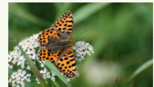
Kleiner Perlmutterfalter Issoria lathonia