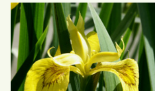
Sumpfschwertlilie Iris pseudacorus