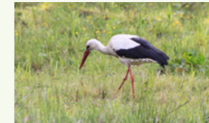
Weißstorch Ciconia ciconia