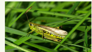
Sumpfschrecke Stethophyma grossus