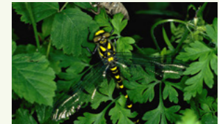
Gestreifte Quelljungfer Cordulegaster bidentata