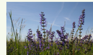
Wiesensalbei Salvia pratensis