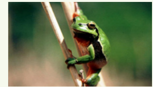
Laubfrosch Hyla arborea