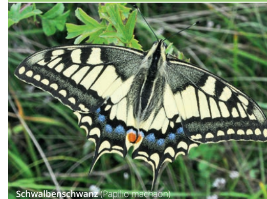
Schwalbenschwanz ( Papilio machaon )