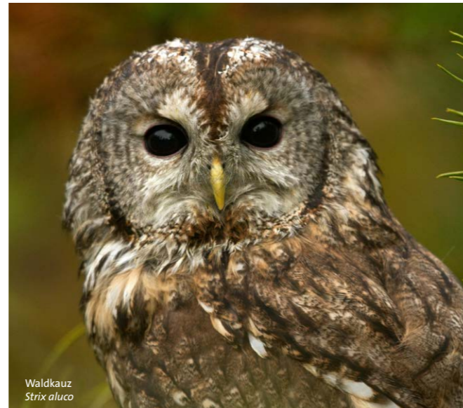
Waldkauz Strix aluco