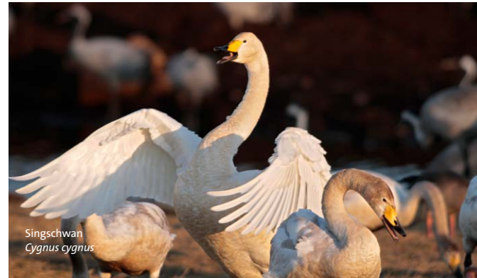
Singschwan Cygnus cygnus