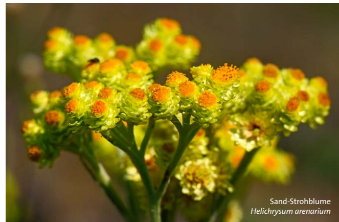
Sand-Strohblume Helichrysum arenarium