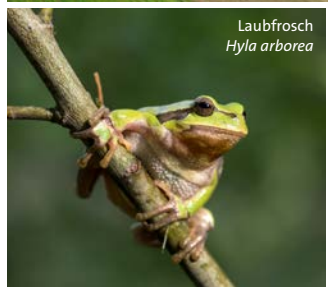
Laubfrosch Hyla arborea