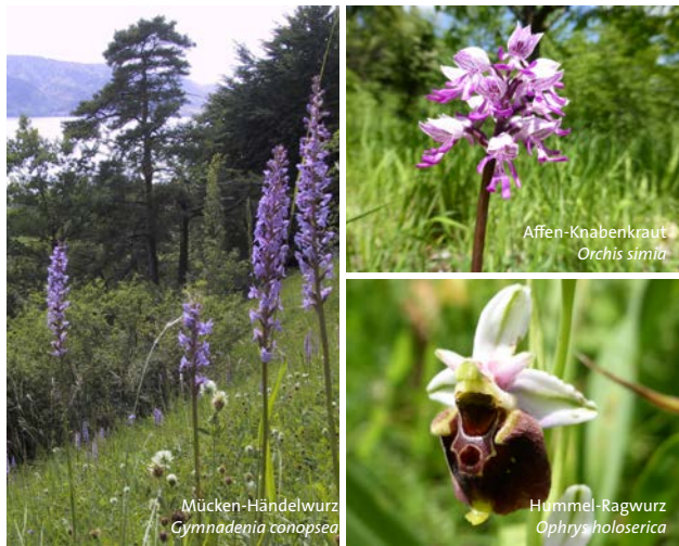
Affen-Knabenkraut Orchis simia