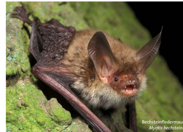
Bechsteinfledermaus Myotis bechsteinii