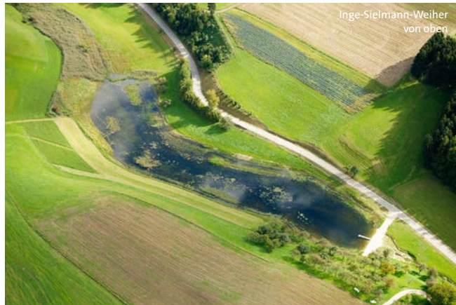
Inge-Sielmann-Weiher von oben