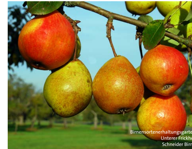
Birnensortenerhaltungsgarten Unterer Frickhof Schneider Birne