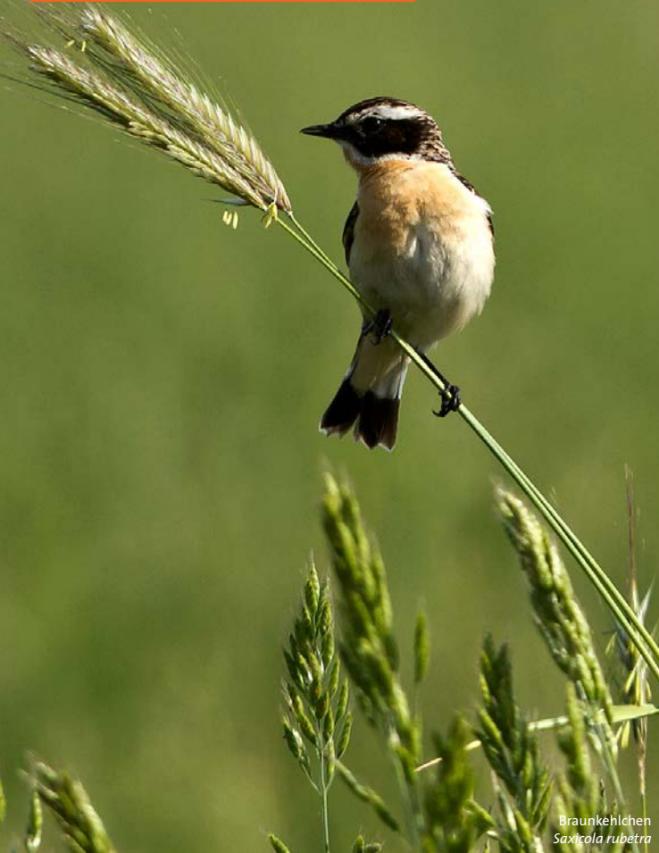
Braunkehlchen Saxicola rubetra